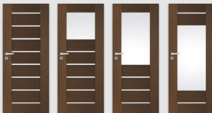
PREMIUM natura PREMIUM 1 natura PREMIUM 2 natura PREMIUM 3 natura

UWAGA: Specyfiką okleiny naturalnej jest możliwość wystąpienia różnic w usłojeniu i wybarwieniu. Różnice te nie mogą być podstawą uznania reklamacji.